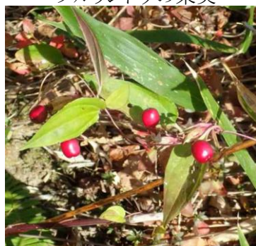
ツルリンドウの果実