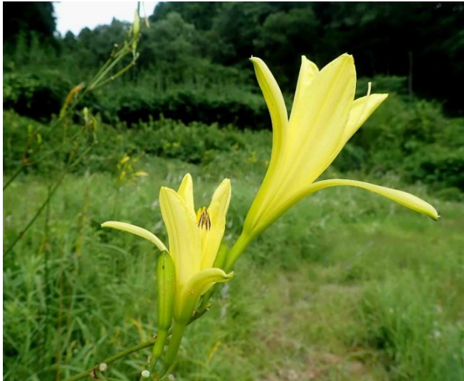
ユウスゲ 14:30頃に蕾が開き始める