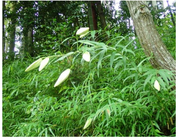
ヤマユリ 今年が一番咲きです

多くのヤマユリは、つぼみの状態 一昨年、イノシシに掘られる被害を 受けたが、多くの株に蕾がついている