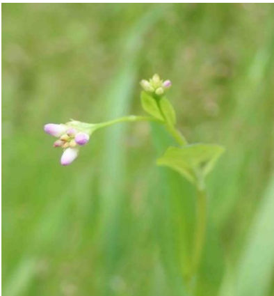
アキノウナギツカミ (葉が茎を抱く)