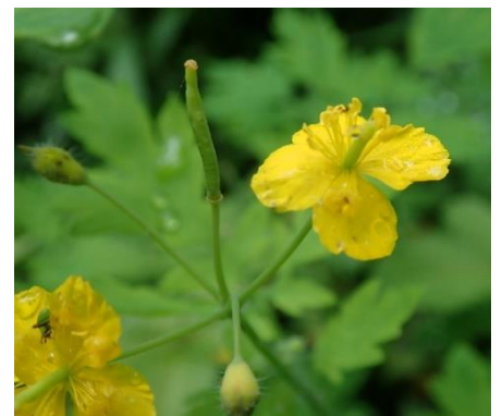
クサノオウ 茎を切ると、黄色の液が...