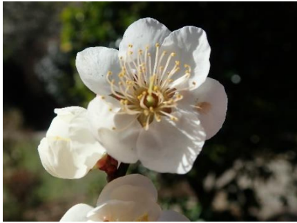
セリバオウレンが咲き始めました。