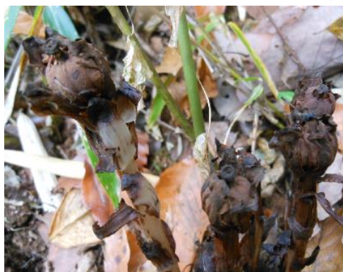
アキノギンリョウソウ