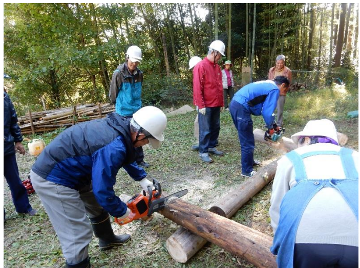
チェーンソー講習会