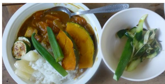
昼食の夏野菜カレー