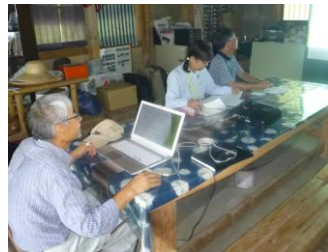
オリエンテーション