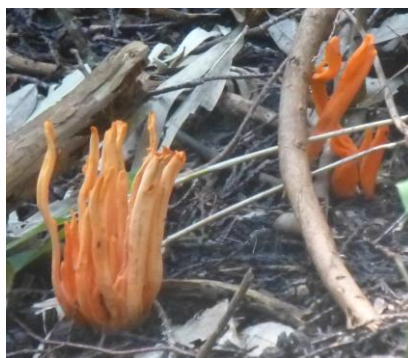
ベニナギナタタケ