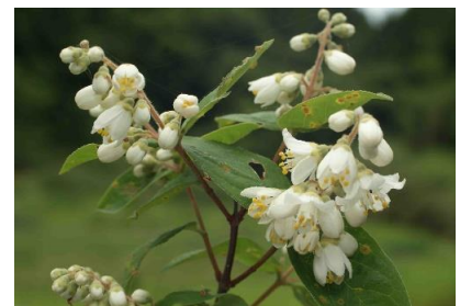
ハコネウツギ(花が白から赤に変化)