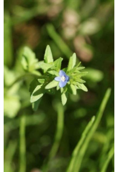
タチイヌノフグリ