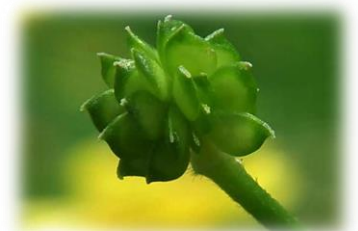
キツネノボタン (キンポウゲ科の花はよく似ているが、葉の形や果実のかたちが違う)