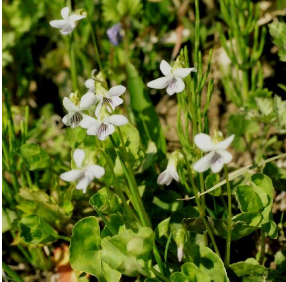
ニョイスミレ (如意堇)