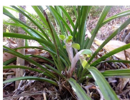
シュンラン(ヲガマ田)