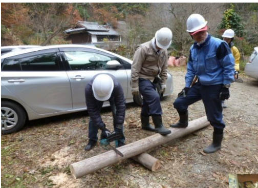
チェーンソー実習