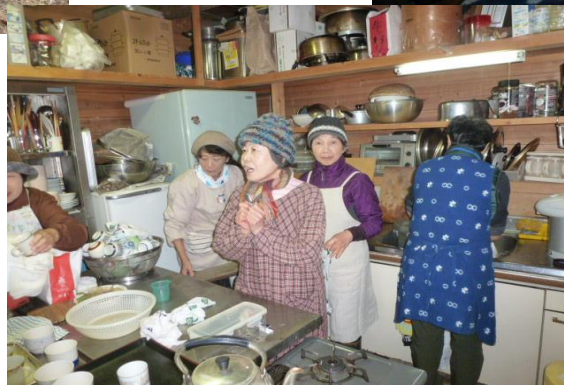
おでん作り お疲れ様でした