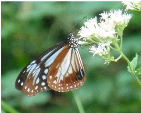
スズラン地区に訪れてくれたアサギマダラ

* 11月の全体会は10日です、ご注意を。(第一金曜日が3日ですが万博NRのため変更)